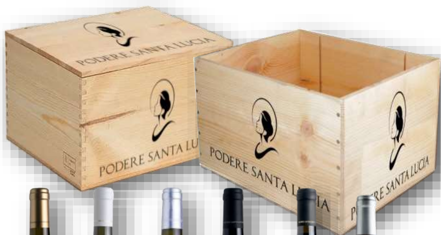
Verdicchio Pellegrino Doc Verdicchio Sup. Gianni Balducci Doc Incrocio Bruni Igt