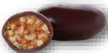
Nougatine - Cod 23CI09