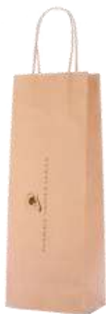
Busta 1 Bott da lt 0.75 Cod 23SCA17 1,50