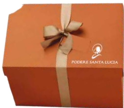
Rettangoletta Orange Ramè