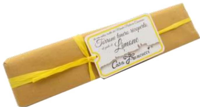
Cod 23PS11 Torrone Mandorlato tenero ri- coperto con cioccolato al Limo- € 13,00 ne - gr 250