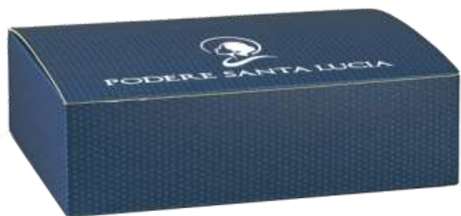
Scatola Spot Blu 3 Bott da lt 0.75 Cod 23SCA15 € 4,00