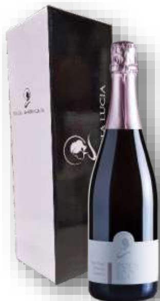
Spumante Metodo Classico Rosè in elegante scatola litografata