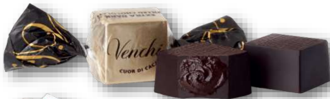
Cubotto Cuor di Cacao - Cod 23CI05