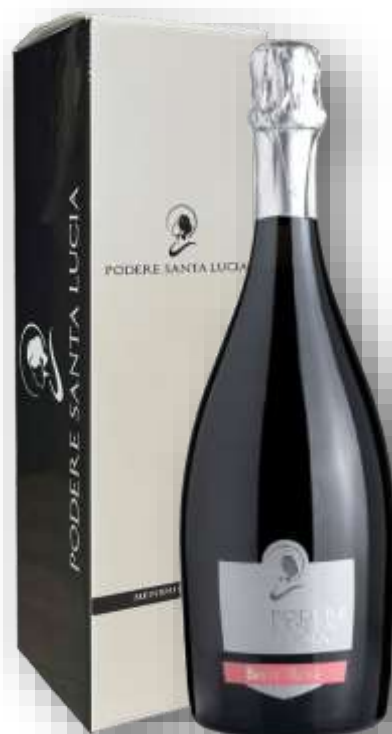
Spumante Metodo Charmat Rosè Magnum in elegante scatola litografata