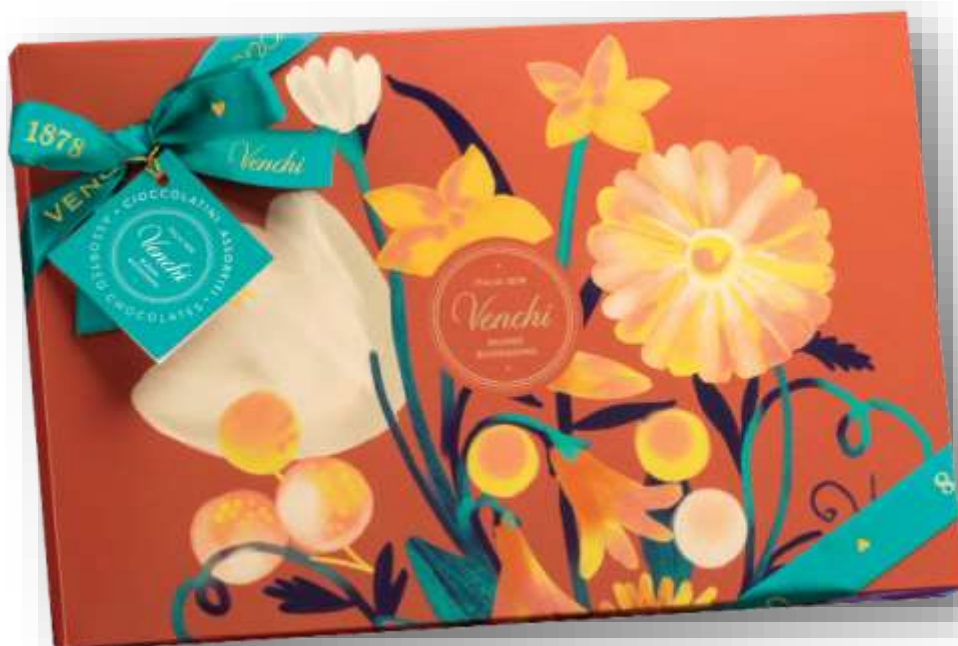
SCATOLA REGALO FLORA

Scatola regalo con assortimento misto Chocomousse latte, Chocomousse Cuor di Cacao, Perla fondente, Perla bigusto latte gianduia e Perla Pistacchio