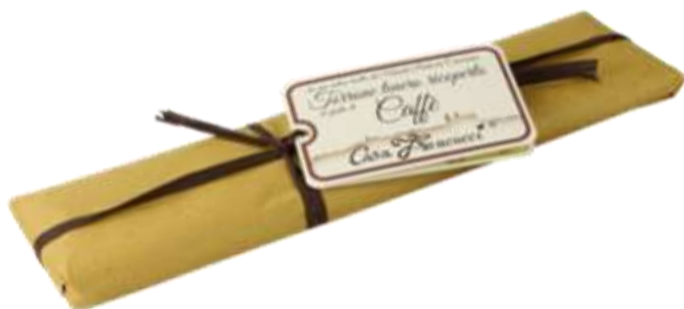
Cod 23PS10 Torrone Mandorlato tenero ri- coperto al cioccolato extra fon- € 13,00 dente, al caffè - gr 250