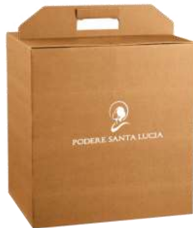
Kubo Skyn deserto