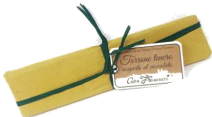
Cod 23PS09 Torrone Mandorlato tenero ricoperto al cioccolato extra € 13,00 fondente - gr 250