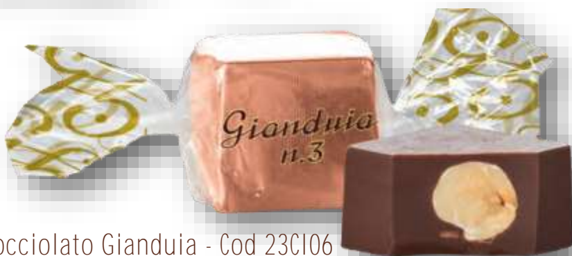
Cubotto Nocciolato Gianduia - Cod 23CI06