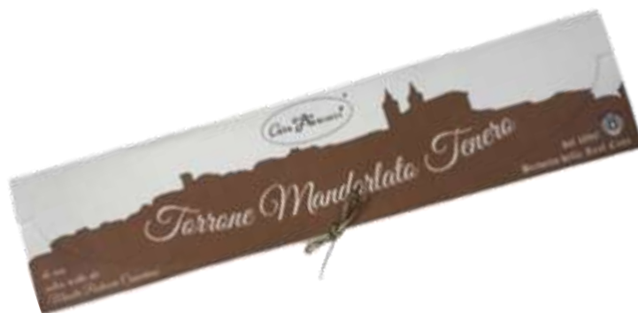
Cod 23PS08 Torrone Mandorlato tenero, consi- stenza morbida, rivestito con ostia € 13,00 - gr 250