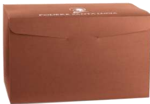
Scatola Seta Corten 4 Bott da lt 0.75 Cod 23SCA16 € 4,00