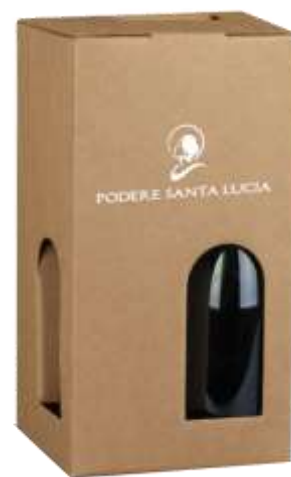
Scatola da 4 Bott da lt 0.75 Cod 23SCA20 € 3,00