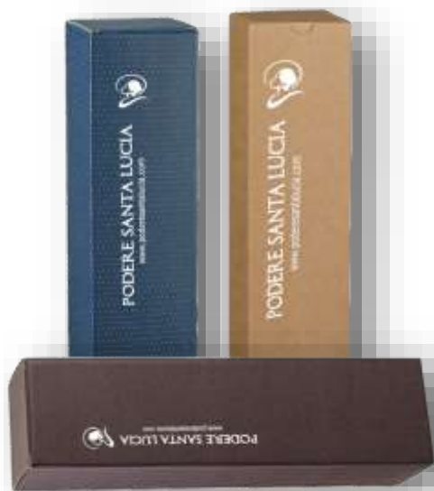
Scatola 1 Bott da lt 0,75 Cod 23SCA12 € 3,00