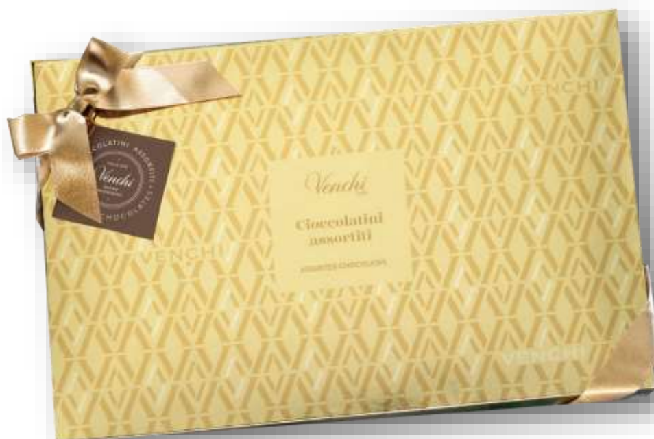
SCATOLA REGALO CORPORATE

Scatola regalo con assortimento di Perle bigusto fondente, ripieno Cuor di Cacao, Chocomousse Cuor di Cacao, Cremino extra fondente e cioccolatino Mandorla Fondente.