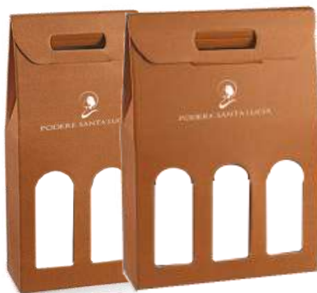
Scatole da 2/3 Bott da lt 0.75 Cod 23SCA18/19 € 3,00