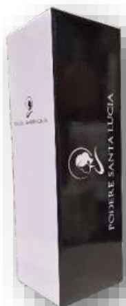
Scatola Podere Santa Lucia bott da lt 0.75 Cod 23SCA13 € 3,00