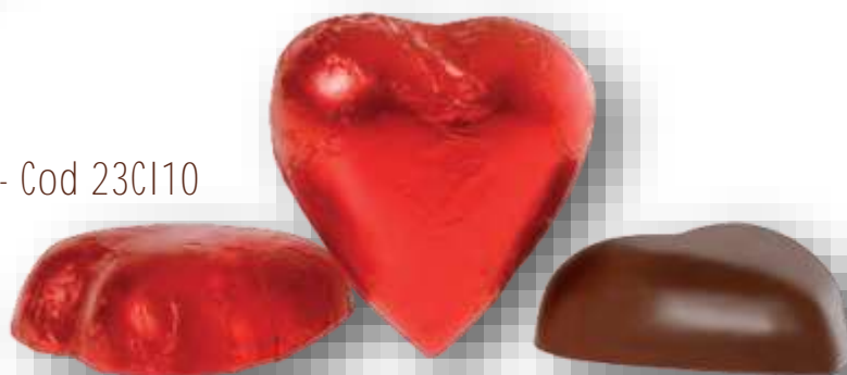
Valentines Latte - Cod 23CI10

Cioccolatini assortiti in sacchetto cellophan gr 100 o multipli.