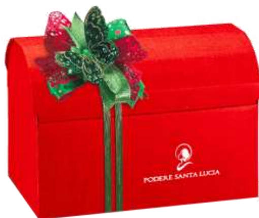
Cofanetto seta Rosso