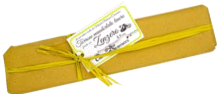
Cod 23PS12 Torrone bianco morbido con note delicate di Zenzero - gr 250 € 13,00